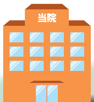
特定機能病院の役割

当院での治療が落ち着きましたら、 再び地域の「かかりつけ医・地域医療機関」へ ご紹介（逆紹介）させていただきます。