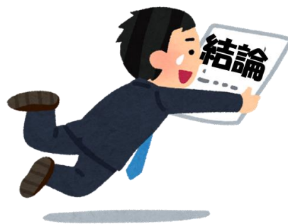
図1. 結論への飛躍のイメージ

妄想を持つ患者さんでは、健康な方に比べてより少ない情報にもとづいて結論を下す、「結論への飛躍 (jumping to conclusions)」(図1) と呼ばれる認知的な傾向があることが知られており、このために誤った考えに至りやすい、つまり妄想の形成しやすさを説明するメカニズムと考えられています。また健康な方の場合は逆に、結論を下すためには客観的な確率が示すよりも多くの情報を要するという「保守性バイアス (conservatism bias)」 と呼ばれる傾向が知られていません。結論への飛躍と保守性バイアスに関わる脳神経領域を探る研究がこれまで行われてきましたが、はっきりした結論には至っていませんでした。