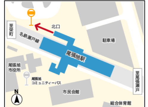
3) 尾張旭駅周辺案内図