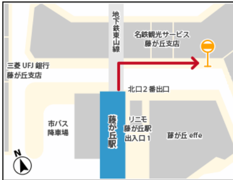
1) 藤が丘駅周辺案内図