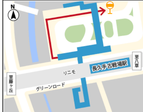
2) 長久手古戦場駅周辺案内図