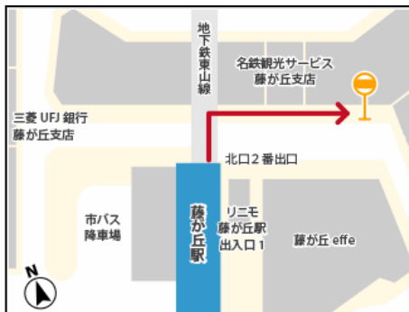
1) 藤が丘駅周辺案内図