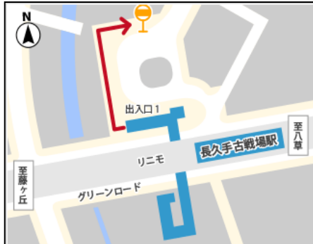
2) 長久手古戦場駅周辺案内図