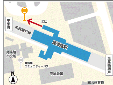
3) 尾張旭駅周辺案内図