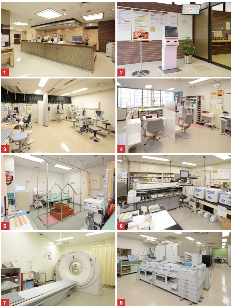
1 1階受付 2 再診受付機 3 診察室（眼科） 4 処置室 5 生理機能検査 6 血液検査（自動分析装置） 7 64列マルチスライスCT装置 8 全自動散薬分包機