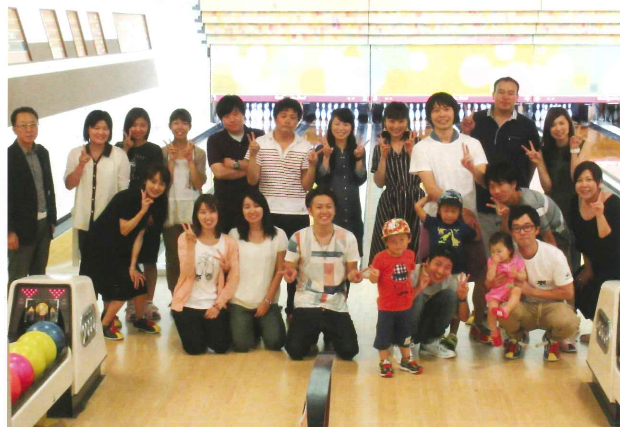
看護学部同窓会 第1回ボウリング大会(平成28年9月10日)